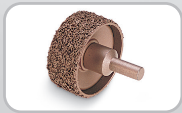
Rebajador para cubierta de banda