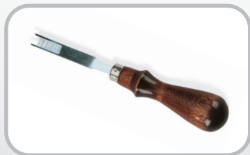
Rebajador de cubierta de banda de superficie corrugada