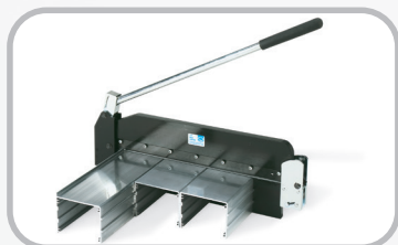
Cortadora de banda de 14"