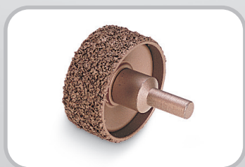
Esmerilhador de correia