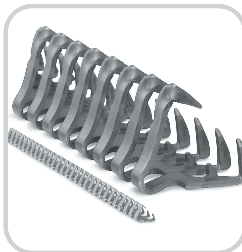
Gráfico de seleção da emenda da correia transportadora Alligator®