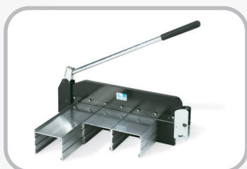
Cortador de correia de 14"