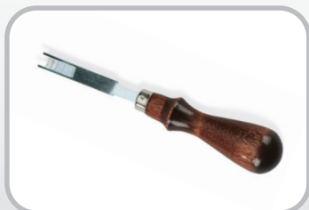
Rebaixador de correia corrugada