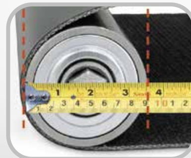
Meça o menor diâmetro da polia.