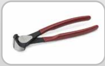
Alicate de correia

*Número de patente: Internacional WIPO WO2009006619A1