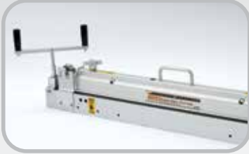
Cortadora de banda serie 900. Cortadora de banda 845LD.