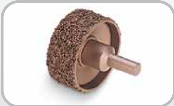
Rebajador para cubierta de banda.