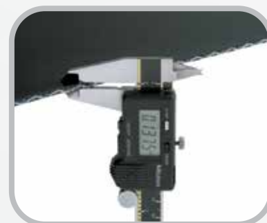
Mida el espesor de la banda.