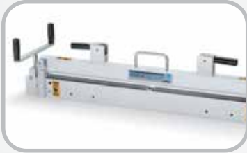
Rebajador de cubierta de banda de superficie corrugada.