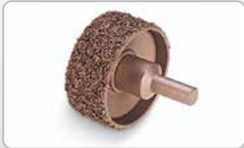
Rebajador para cubierta de banda.