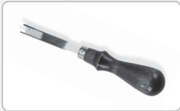
Rebajador de cubierta de banda de superficie corrugada.