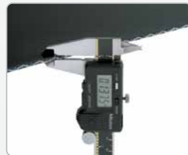
Mida el espesor de la banda.