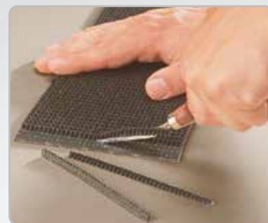
Desbaste la cubierta de impresión.

Consulte la tabla de selección de material de la página 2 para ver las características de metal que se adaptan mejor a su aplicación. No todos los tamaños y estilos están disponibles en todos los metales.