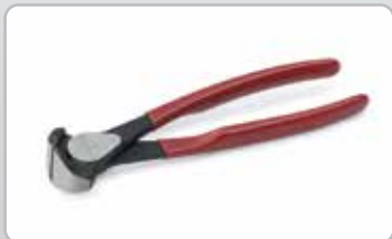
Pinzas para banda.