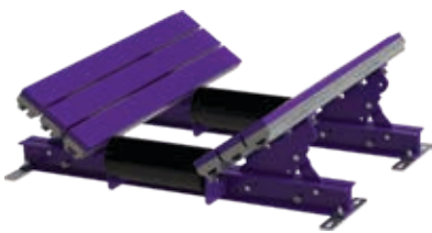
配标准托辊的滑床 (EZSB-C)