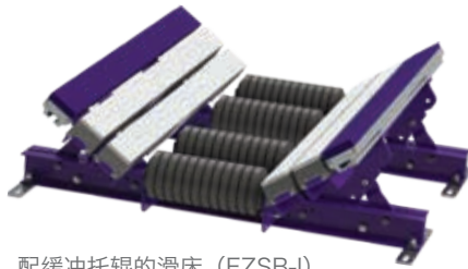
配缓冲托辊的滑床 (EZSB-I)