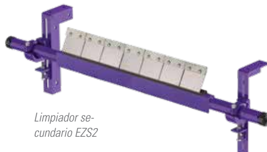
Limpiador secundario EZS2