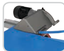
El cortador de paso opcional prepara las bandas al quitar rápidamente la capa superior con un corte vertical y horizontal simultáneo.