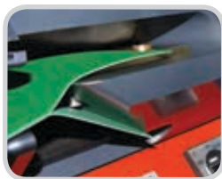
Separación exacta entre bandas, con cortes tan delgadas como 0.014" (0.35 mm)

La construcción sólida del Ply 130 permite la separación precisa de bandas termoplásticas, tanto gruesas como finas. Se puede separar una capa tan pequeña como 0.014" (0.35 mm), permitiendo que los usuarios creen un recubrimiento/ película de la banda utilizada en el proceso de empalme.