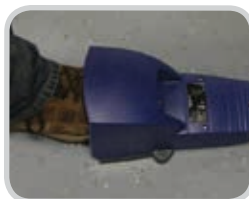
El pedal controla el movimiento de la banda hacia adelante, permitiendo el funcionamiento a manos libres