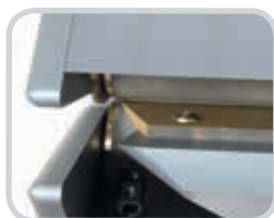
El aditamento sólido de la hoja está protegido, solo con una abertura de 0.4" (10 mm)