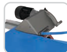
El cortador de paso opcional prepara las bandas al quitar rápidamente la capa superior con un corte vertical y horizontal simultáneo.