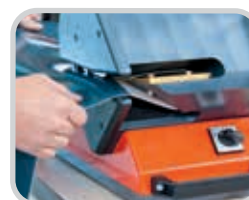
Separe hasta 130 mm (5") en un solo paso para la preparación perfecta de los empalmes graduales y las grapas mecánicas empotradas