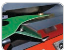
Separación exacta entre bandas, con cortes tan delgadas como 0.35 mm (0.014")

La construcción sólida del Ply 130 permite la separación precisa de bandas termoplásticas, tanto gruesas como finas. Se puede separar una capa tan pequeña como 0.35 mm (0.014"), permitiendo que los usuarios creen un recubrimiento/ película de la banda utilizada en el proceso de empalme.