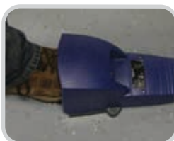
El pedal controla el movimiento de la banda hacia adelante, permitiendo el funcionamiento a manos libres