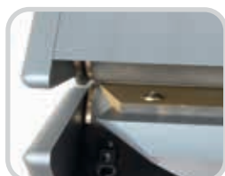
El aditamento sólido de la hoja está protegido, solo con una abertura de 10 mm (0.4")