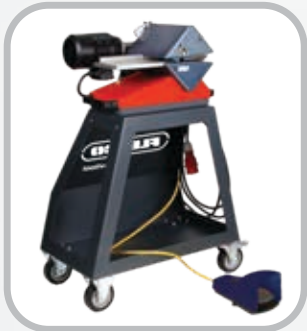
Carretilla opcional de Ply 130™ *altura de corte óptima de 960 mm (39")

La Ply Cart proporciona un método conveniente para usar Ply 130™ a través del taller de trabajo ligero. Ya no es necesario fabricar carretillas a la medida o comprar carretillas para servicio, que no son óptimas para el transporte de los separadores de capas. Las unidades de Ply 130 que se vendían con anterioridad se montan fácilmente en la carretilla utilizando una bandeja modificada.