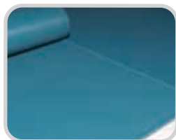
Permite que el operador separe el recubrimiento/película de la cubierta de la banda para llenar los espacios y cavidades con el mismo color y material de la banda