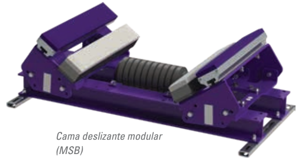
Cama deslizante modular (MSB)