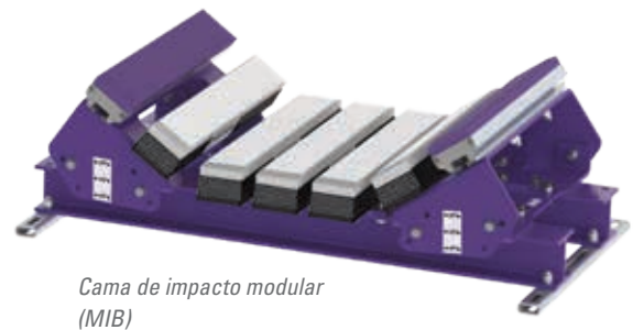
Cama de impacto modular (MIB)