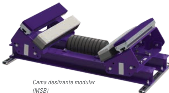
Cama deslizante modular (MSB)