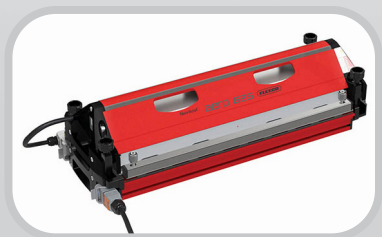
Prensa de empalme Novitool® Aero®