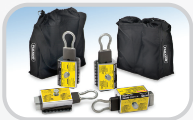
Mordazas para banda Smart Clamp™