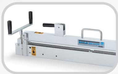
Cortadora de banda Clipper® 845LD

La Laser Belt Square de Flexco se puede utilizar junto con estos productos de Flexco para mantener las bandas transportadoras de paquetes funcionando según su rendimiento máximo.