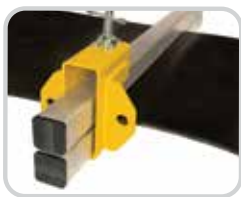
Mordazas sobre la banda para más resistencia

Flexco comprende que la seguridad del trabajador es de máxima prioridad cuando se reparan bandas que transportan cargas muy grandes. Las mordazas para banda TUG™ HD® de Flexco se diseñaron para asegurar la banda para su reparación cumpliendo con las normas de pruebas de seguridad más exigentes. Las mordazas para banda TUG HD, disponibles en versiones de 6 y 8 toneladas, proporcionan tensión cruzada en todo el ancho de la banda para ofrecer resistencia máxima. Los componentes modulares permiten versatilidad y portabilidad mejoradas.