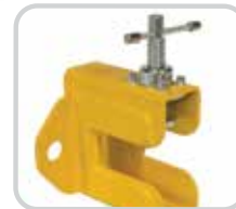
Los extremos de la banda presentan más capacidad para facilitar la inserción de la barra de la mordaza