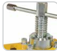
La rosca Acme ofrece resistencia de agarre superior y permite a los operadores la posibilidad de liberar lentamente la banda después del mantenimiento