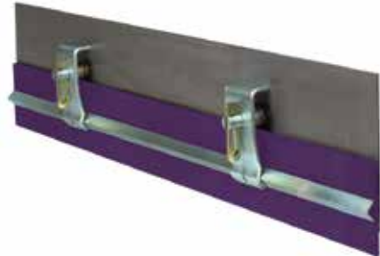
Seitenabdichtungsklemme RMC1 (Standard)

*Einschließlich zwei Halteplatten (Standard oder LS [begrenzter Platz]), zwei Haltestiften und einem Klemmbalken, 1,2 m lang. Seitenabdichtungsleiste und -Seitenabdichtung nicht enthalten. Dicke Seitenabdichtung: 8 bis 19 mm