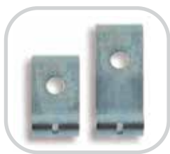
Optionale Seitenabdichtungsklemmen bei wenig Platz

Die Seitenabdichtungsklemmen RMC1 liefern eine kostengünstige Lösung für Überlaufprobleme in den Ladezonen Ihrer Förderanlage. Ein effektives Zurückhalten des Fördermaterials in der Ladezone vermindert Probleme mit der Förderanlage und spart Reinigungskosten. Es verhindert Materialverlust und Sicherheitsgefahren und reduziert den Verschleiß und den vorzeitigen Ausfall von Förderband-Komponenten.