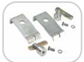
Anschraubbare PAL PAK verfügbar, wenn nicht geschweißt werden kann