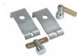
PAL PAK (Standard)