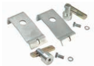
Anschraubbarer PAL PAK

*Einschließlich zwei anschraubbarer Haltestifte und zwei Halteplatten