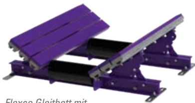
Flexco Gleitbett mit Standardrolle (EZSB-C)