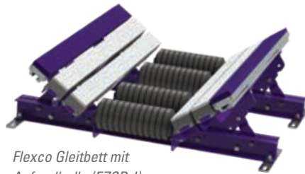
Flexco Gleitbett mit Aufprallrolle (EZSB-I)