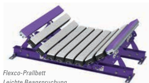
Flexco-Prallbett Leichte Beanspruchung (EZIB-L)