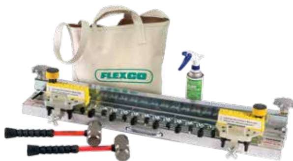
MSRT de aluminio

La herramienta de aplicación de grapas muy económica es portátil y liviana, así que es ideal para reparaciones rápidas. La herramienta de instalación de 6 libras R2T instala hasta 300 mm (12") de grapas en un solo movimiento. Para bandas más anchas, sencillamente mueva la herramienta. Para utilizar con los remaches de fijación automática SR estándar y un martillo de dos libras.