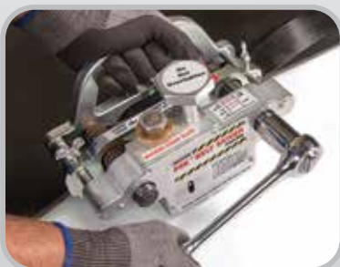
Desbastador completo con barra protectora de metal