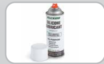
Lubricante de silicón