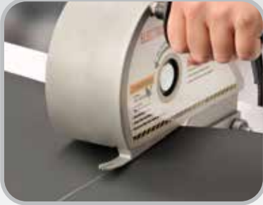
Cortadora de banda eléctrica

Sistema de grapas abisagradas con remaches