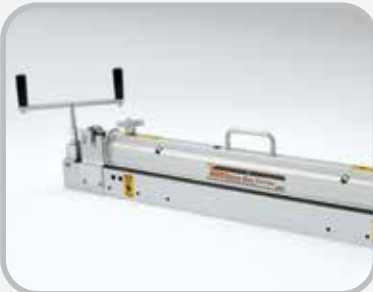
Cortadora de banda Serie 900*