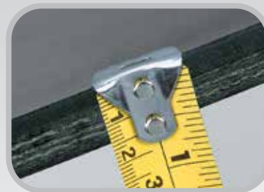
Mida el espesor de la banda