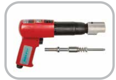
Herramienta de instalación de remaches neumática