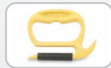
Agarre de la banda