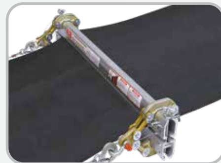
Mordazas para banda Far-Pul™ HD® trabajo pesado