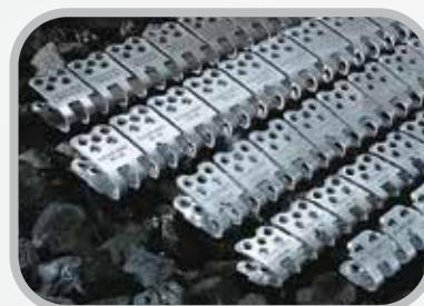
Seleccione el tamaño de grapa