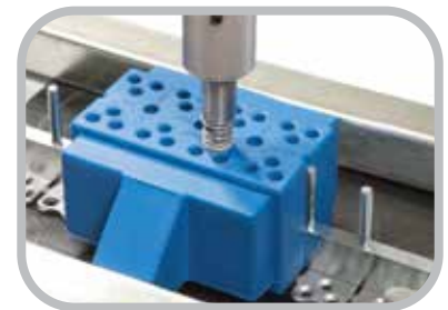
Instalación de la herramienta de Instalación de remaches neumática

La herramienta de trabajo pesado permite más compresión de las grapas de placa lo que da como resultado un empalme suave y consistente es compatible con los componentes del transportador.