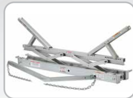
Elevador para transportador de banda Flex-Lifter™