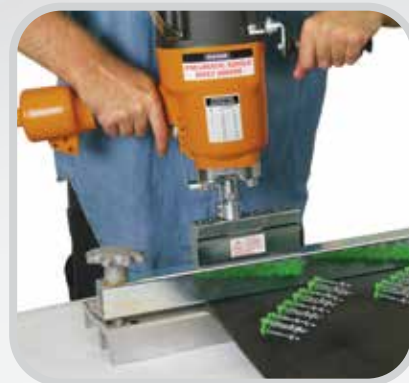
Empalme congruente y durable cada vez