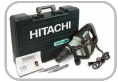
Herramienta de instalación de remaches accionada por electricidad

*Incluye la herramienta de instalación de remaches neumática, resorte de retención y remachador con arandela y resorte de sujeción.