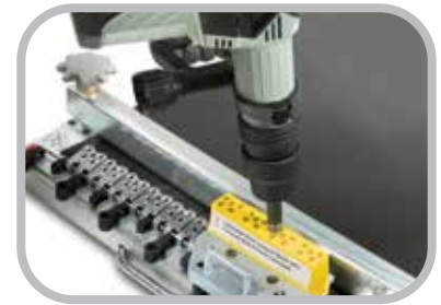
Herramientas de Instalación de remaches eléctrica