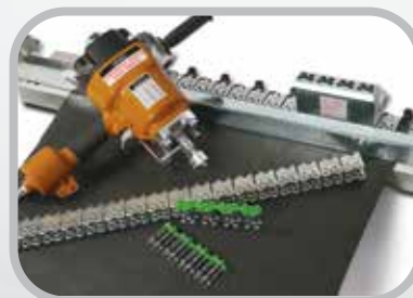
Seleccione el método de instalación