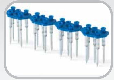
Tiras de remaches en cartuchos Rapid Loader™