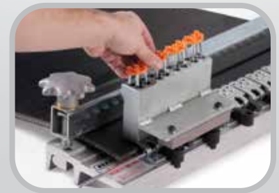
Agilizan el tiempo de instalación