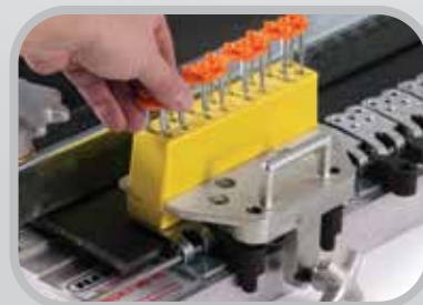
Seleccione los remaches