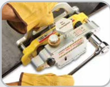
Desbastador de banda FSK™