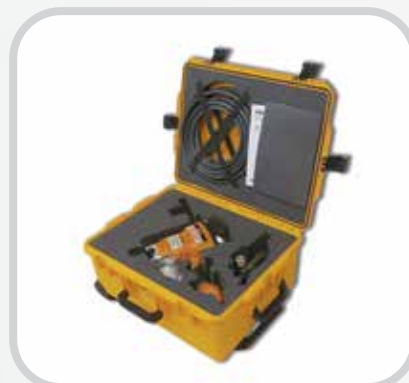
La herramienta de instalación de remaches individual neumática está protegida con un estuche portátil