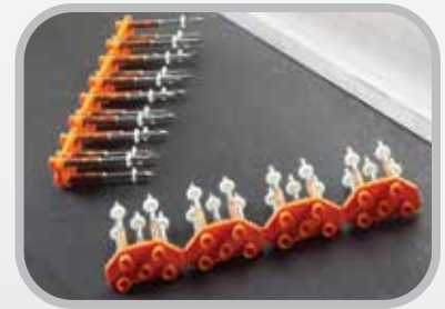
Tiras de remaches en cartuchos Rapid Loader™ con arandelas