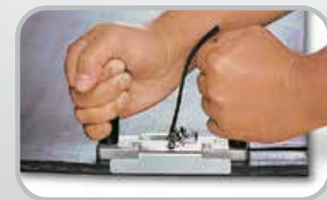
Desbastador de banda Flexco®