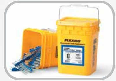
Empacadas convenientemente, fáciles de usar