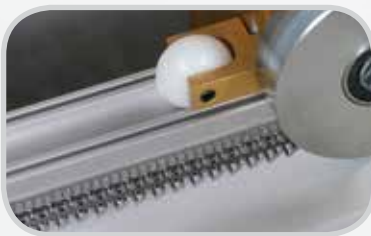
Grapas de mantenimiento Clipper®, rápida instalación en el lugar de engrapado G Series™ con Roller Lacing Technology™ de precisión