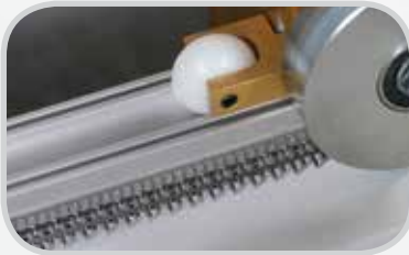
Clipper® 维护钉扣机 — 利用精确的 Roller Lacing Technology™ 快速安装 G Series™ 带扣