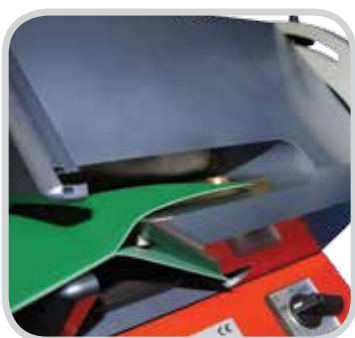
Separe entre capas

Ply 130™ se utiliza para separar las capas de un transportador de banda. Esta acción de corte generalmente se requiere antes de realizar un empalme de una banda con una prensa de empalme. Una gran ventaja de este separador de capas es que puede separar tan profundo como 5 pulg (130 mm) en un movimiento. Esto es especialmente útil cuando separan bandas muy delgadas o bandas donde el material es difícil de cortar, como las bandas delgadas de poliuretano. Ply 130 es una herramienta excelente para preparar empalmes escalonados y para hacer cavidades en las grapas mecánicas.