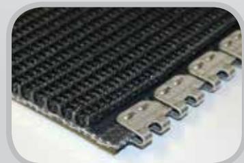
Prepárese fácilmente los extremos de la banda para la instalación de la grapa empotrada.