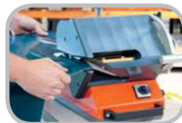
Separe hasta 5" (130 mm) en un solo movimiento