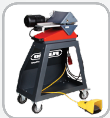
Carretilla opcional de Ply 130 *altura de corte óptima de 39" (960 mm)

La Carretilla de capas proporciona un método conveniente para utilizar Ply 130 en el taller de trabajo liviano. Ya no es necesario fabricar carretillas a la medida o comprar carretillas para servicio, que no son óptimas para el transporte de los separadores de capas. Las unidades de Ply 130 que se vendían con anterioridad se montaban fácilmente en la carretilla utilizando una bandeja modificada.