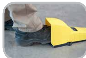
Pedal para operación con dos manos