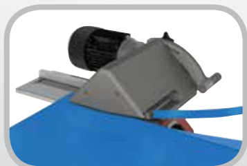
Cortador de paso opcional

El Cortador de pasos opcional prepara con eficiencia las bandas para los empalmes escalonados o empalmes mecánicos empotrados. La capa superior se retira fácilmente con un corte simultáneo vertical y horizontal.