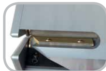
Accesorio sólido de la hoja

Ply 130™ se puede utilizar para preparar empalmes de dedo sobre dedo y escalonados. Con una sola manija usted determina la posición de separación del grosor de la banda. Es posible separar cada capa de la banda y de esta manera generar dos o tres separaciones en una banda.