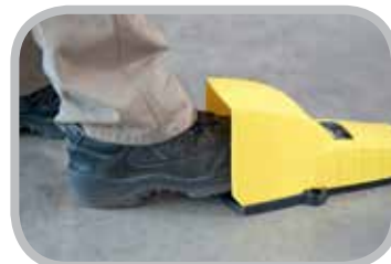
Pedal para operación con dos manos