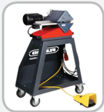
Carretilla opcional de Ply 130 *altura de corte óptima de 39" (960 mm)

La Carretilla de capas proporciona un método conveniente para utilizar Ply 130 en el taller de trabajo liviano. Ya no es necesario fabricar carretillas a la medida o comprar carretillas para servicio, que no son óptimas para el transporte de los separadores de capas. Las unidades de Ply 130 que se vendían con anterioridad se montaban fácilmente en la carretilla utilizando una bandeja modificada.