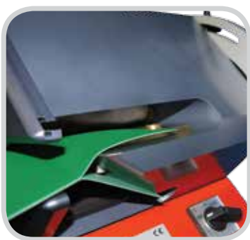
Separe entre capas

Ply 130™ se utiliza para separar las capas de un transportador de banda. Esta acción de corte generalmente se requiere antes de realizar un empalme de una banda con una prensa de empalme. Una gran ventaja de este separador de capas es que puede separar tan profundo como 5 pulg (130 mm) en un movimiento. Esto es especialmente útil cuando separan bandas muy delgadas o bandas donde el material es difícil de cortar, como las bandas delgadas de poliuretano. Ply 130 es una herramienta excelente para preparar empalmes escalonados y para hacer cavidades en las grapas mecánicas.