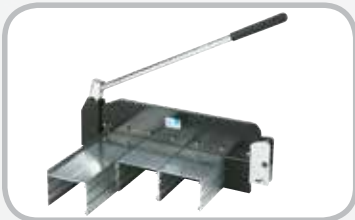
Cortador de banda de 14"