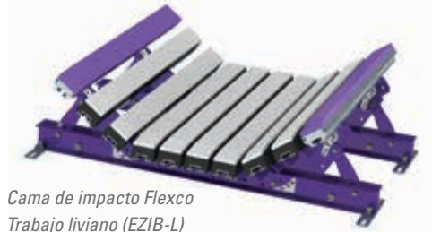
Cama de impacto Flexco Trabajo liviano (EZIB-L)