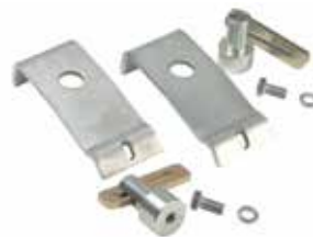
PAL PAK atornillable