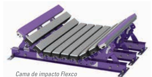
Cama de impacto Flexco Trabajo medio (EZIB-M)