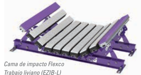
Cama de impacto Flexco Trabajo liviano (EZIB-L)