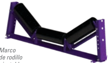
Marco de rodillo ajustable