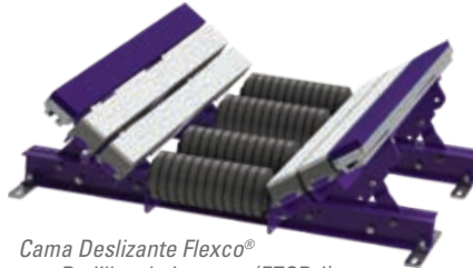
Cama Deslizante Flexco® con Rodillos de Impacto (EZSB-I)