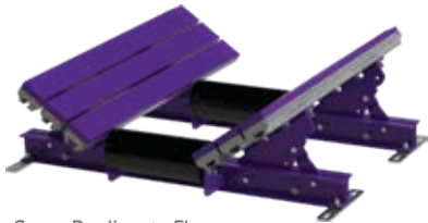
Cama Deslizante Flexco con Rodillos Estándar (EZSBC)