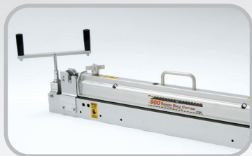
Máy cắt dây đai seri 900