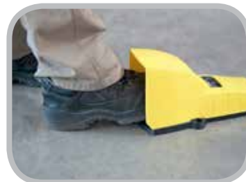
両手操作作用フットペダル