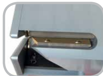
しっかりしたブレード固定部

また、PLY 130™ は (ダブル) フィンガー継手やステップ継手の準備にもご利用いただけます。1 回のハンドル操作で、ベルトのセパレート位置 (厚さ) を決められます。ベルトの層ごとにスライスが可能なので、1本のベルトで2、3箇所をスライスできます。