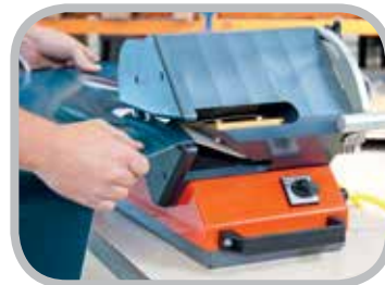
シングルパスで最大 130 mm (5") までセパレート可能