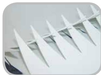
制作准确的齿形接头