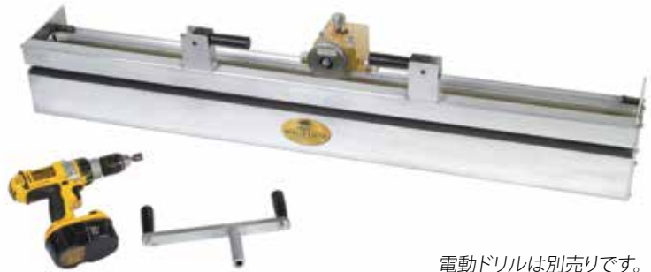
電動ドリルは別売りです。