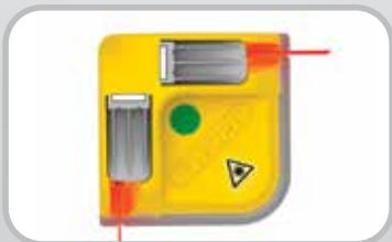
ベルト用レーザー標識線計