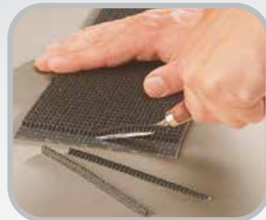
インプレッションカバーの剥ぎ取り

「フック材質特性表」(2 ページ)をご参照のうえ最適なフック材をお選びください。材質により選択できないフックもありますのでご注意ください。