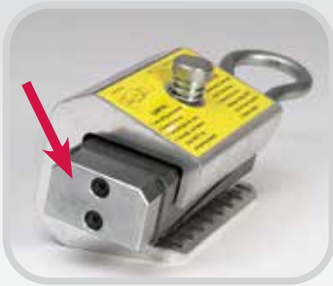
Große Schlagfläche für einfache Handhabung