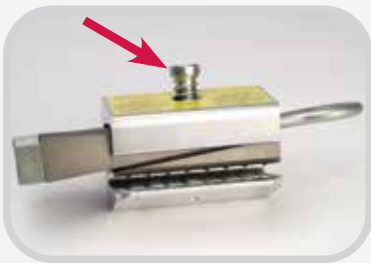
Rückstellfedermechanik hält die Keile oben, damit das Band einfach eingeführt werden kann.