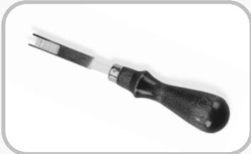
Rebajador para cubierta de banda. Pinzas para banda.