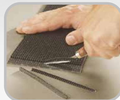
Desbaste la cubierta de impresión.