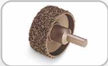
Rebajador para cubierta de banda.