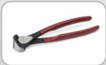
Pinzas para banda.