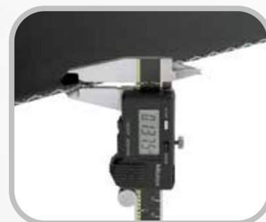
Mida el espesor de la banda.