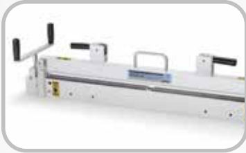
Rebajador de cubierta de banda de superficie corrugada.