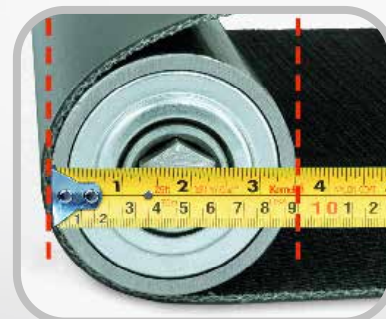
Mida el diámetro de la polea más pequeña.