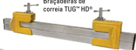
Braçadeiras de correia TUG™ HD®