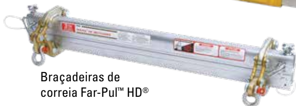
Braçadeiras de correia Far-Pul™ HD®