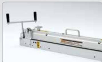
Cortadora de banda serie 900*