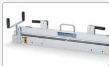
Cortadora de banda 845LD.