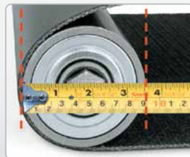
Mida el diámetro de la polea más pequeña.