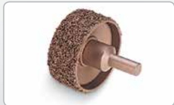
Rebajador para cubierta de banda.