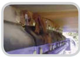
Puntas de carburo de tungsteno durables

El limpiador de banda secundario R-Type® Flexco se puede usar en bandas reversibles y de una dirección y está diseñado para colocarse justo fuera de la polea motriz para eliminar las astillas y cortezas de la banda. Individual o cuando se usa junto con un prelimpiador, el limpiador R-Type es una opción confiable para el mantenimiento de un sistema de limpieza muy eficiente en el patio maderero.