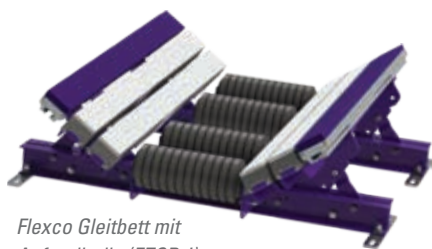
Flexco Gleitbett mit Aufprallrolle (EZSB-I)