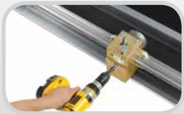
Herramientas de fabricación de la banda Novitool®