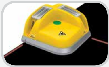
Sistemas de sujeción de ganchos de alambre de Laser Belt Square Clipper®