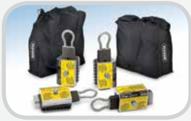
Mordazas para banda Smart Clamp™

Utilice la Cortadora de banda 845LD junto con estos productos de Flexco para mantener las bandas transportadoras de paquetes funcionando según su rendimiento máximo.