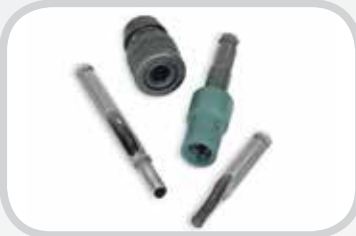
Herramientas eléctricas de instalación