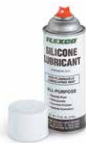
Aerosol lubricante de silicón

Con un martillo y cinzel rompetuercas puede reemplazar fácilmente las placas desgastadas, sin recurrir al reemplazo de todo el empalme.