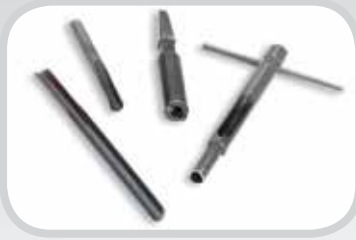
Herramientas manuales de instalación