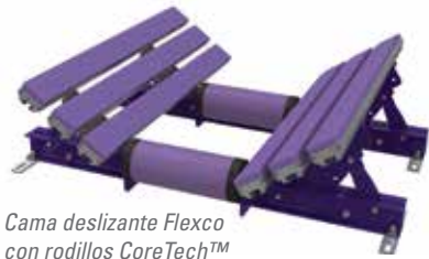
Cama deslizante Flexco con rodillos CoreTech™ (EZSB-C)