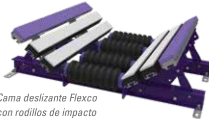
Cama deslizante Flexco con rodillos de impacto CoreTech™ (EZSB-I)