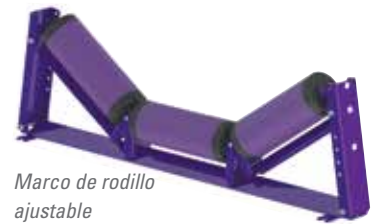
Marco de rodillo ajustable