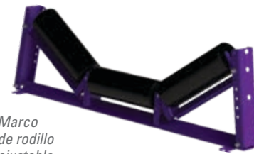
Marco de rodillo ajustable