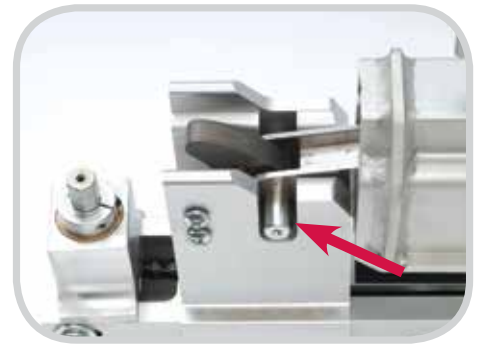
允许夹梁下降入位