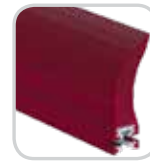
Temperatura Ultra Alta