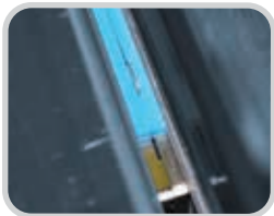
La cortadora de banda integrada mantiene una inclinación precisa en una sola pasada

Las plantillas personalizadas aseguran la banda cuando se cortan para garantizar un control de inclinación preciso. Después el proceso de calentamiento sin contacto une la banda en menos de un minuto y termina con una cantidad controlada de material de empalme. Para garantizar empalmes de calidad, se evitan los agujeros por medio de las soluciones diseñadas tales como la función de pre-calentamiento para eliminar la humedad de los extremos de la banda; la zona de calor protegida diseñada para el calentamiento consistente bajo varias condiciones ambientales; y el método de calentamiento sin contacto. La precisión, rapidez y seguridad del operador están completamente integradas en el diseño de Amigo, lo que la convierte en una herramienta de empalme ideal para empalmes en el taller o en el campo.