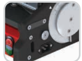
Opera en Fase individual 115 voltios o 230 voltios