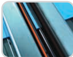
El calentamiento sin contacto proporciona una cantidad controlada de colisión sin un contacto real con la fuente de calor