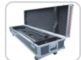
Estuche para transporte personalizado para un almacenamiento y transporte fácil