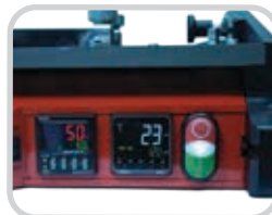
Control digital de tiempo con ajustes rápidos, simples de empalme; el Ajuste de pre-calentamiento se puede utilizar para eliminar la humedad y evitar los agujeros