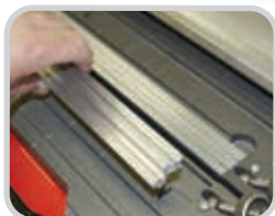
Plantillas intercambiables de empalme para el ángulo de inclinación preciso del empalme de las bandas de varios fabricantes de bandas