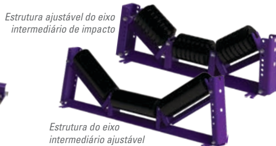
Estrutura do eixo intermediário ajustável