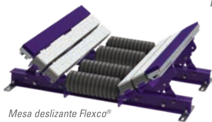
Mesa deslizante Flexco® com rolos de impacto (EZSB-I)