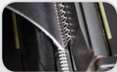
Clipper® 生產釘扣機 — 大量安裝 G Series™ 釘扣最快、最精準的方法