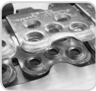
Rápida, precisa colocación de las tiras de la grapa.