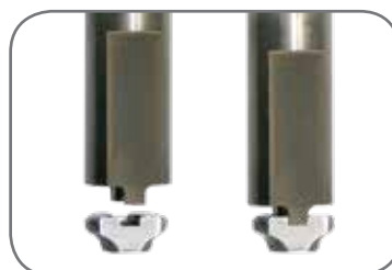
Exclusivo para Flexco