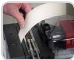
La estación de enfriamiento incorporado asegura el material de parche con la cinta de lavado