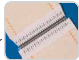
Los puntos de engrapado se cubren con el parche durante la instalación