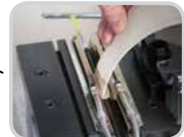
Las mordazas calientes activan la goma durante el proceso de instalación rápida