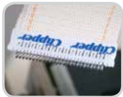
Hay logotipos de parches personalizados