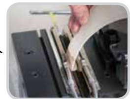
快速安装过程中加热夹爪 活化粘胶